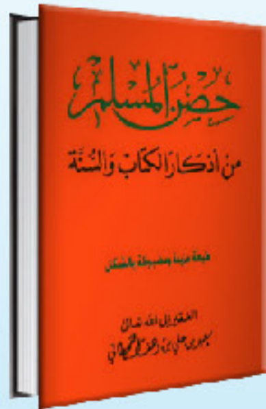
HISN AL MUSLIM