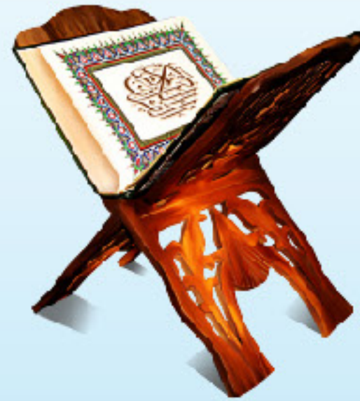
THE GLORIOUS QURAN